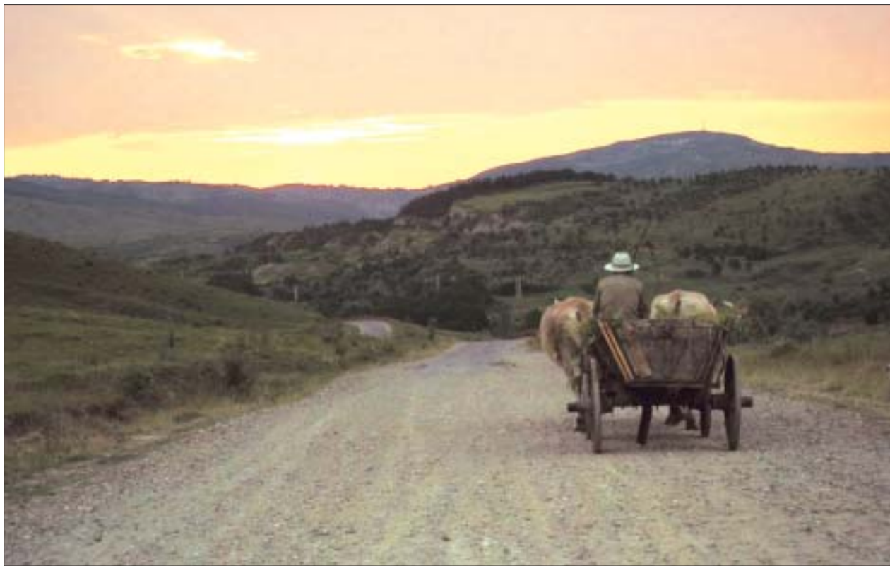
Doru Cristache (Buzău), fotografie nominalizată în cadrul concursului HotNews.ro