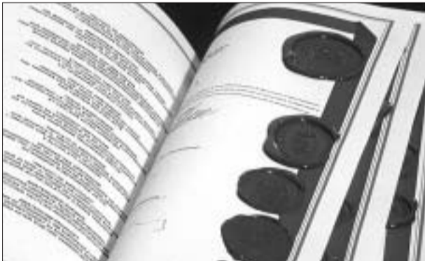
Tratatul de la Amsterdam