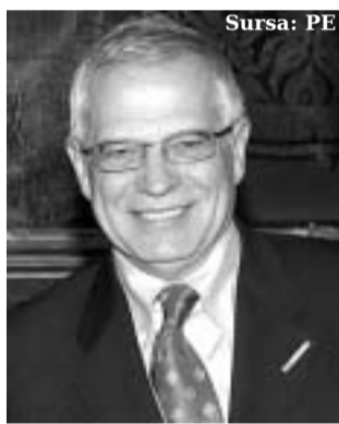
Josep Borrell Fontelles, președintele Parlamentului European

Sediul PE este la Strasbourg, dar secretariatul este localizat în Luxemburg, în timp ce anumite sesiuni și comitete au loc la Bruxelles. Tot în capitala Belgiei își au sediul grupurile politice din Parlamentul European. Parlamentarii europeni sunt aleși pentru un mandat de cinci ani, iar președintele instituției este desemnat de parlamentari, având un mandat de doi ani și jumătate. Actualul președinte al PE este spaniolul Josep Borrell Fontelles. Înființat încă din 1952, sub numele de Adunare Parlamentară, a ajuns