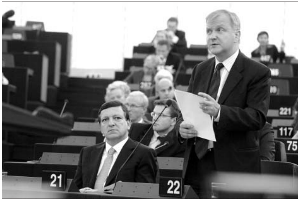
Olli Rehn, comisarul pentru extindere, prezintă raportul de monitorizare cu privire la România și Bulgaria în Parlamentul European, Strasbourg, 26 septembrie 2006. La dreapta lui Rehn, ascultă atent președintele Comisiei Europene, José Manuel Barroso.

Felicitările au curs lanț pentru România, timp de mai multe zile după prezentarea raportului de monitorizare al Comisiei Europene. Oficialii de la Bruxelles s-au declarat încântați de progresele făcute în toate domeniile și consideră că ne aflăm pe drumul cel bun. Greul acum începe.