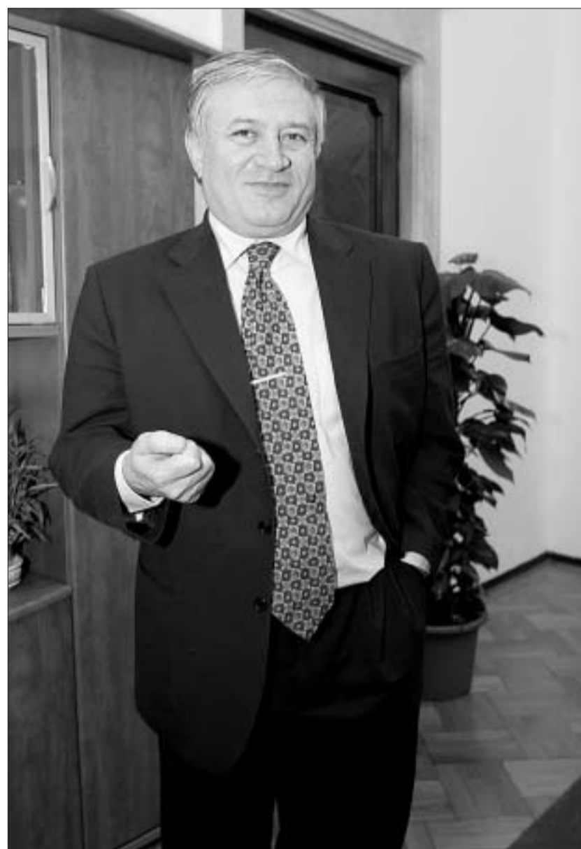
Mihai Berinde, președintele Consiliului Concurenței

Mihai Berinde: Rolul Consiliului Concurenței în domeniul ajutorului de stat se va schimba, această instituție devenind „punctul național de contact” între mediul de afaceri, autoritățile din România și forurile competente din Uniunea Europeană. Pregătindu-se pentru