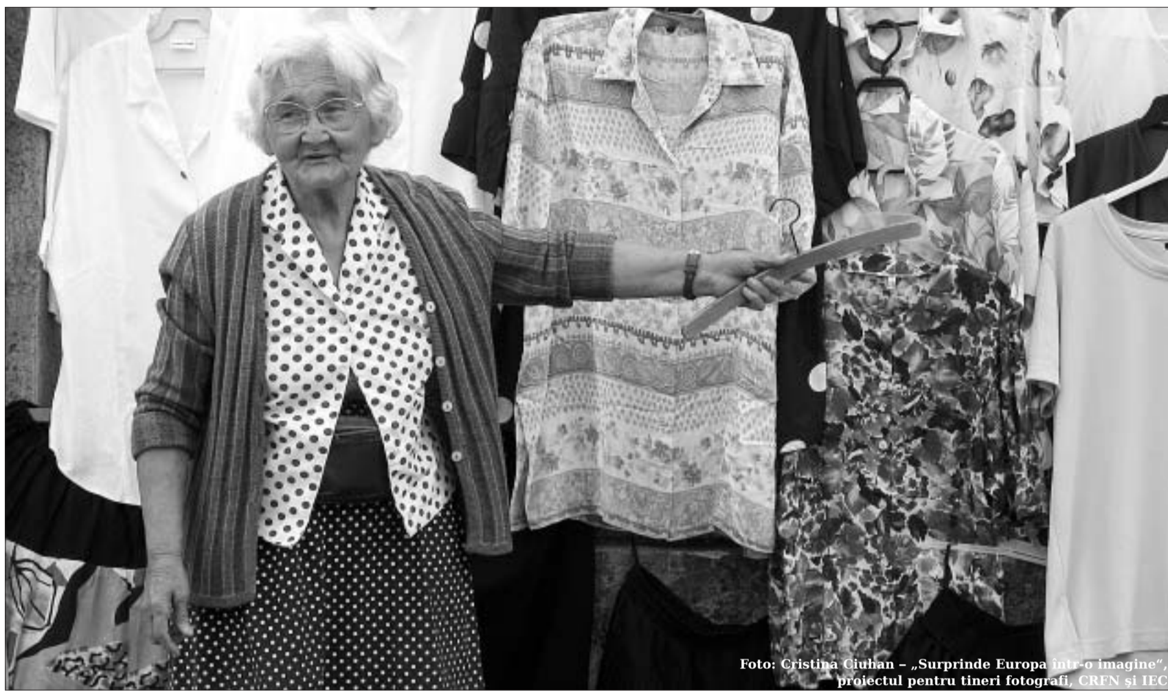
Foto: Cristina Ciuhan - „Surprinde Europa într-o imagine”, proiectul pentru tineri fotografi, CRFN și IEC

Realitate: România va contribui la bugetul UE cu aproximativ 800 de milioane euro și va primi, în medie, 2 miliarde euro anual (conform pachetului financiar). În perioada 2007-2009, suma alocată României este de 11 miliarde euro, din care plăți efective aproximativ 6 miliarde euro (plățile se fac pe măsura derulării proiectelor).