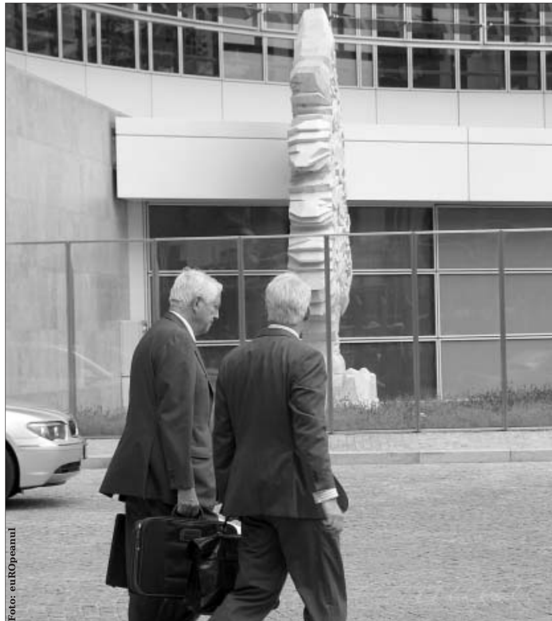
Sediul Comisiei Europene, Bruxelles

Detalii despre programele operaționale găsiți în pagina 3