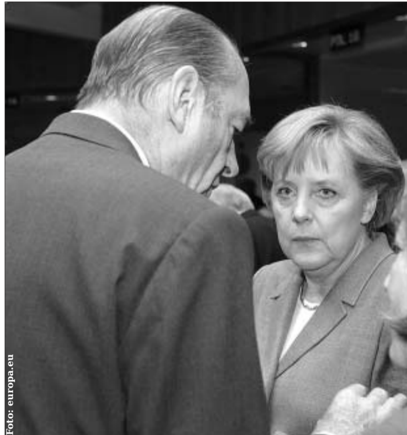
Președintele Franței, Jacques Chirac, și cancelarul german, Angela Merkel, doi grei din vechea Europă

Notă: Continuare, în numărul următor: despre politica Angliei și a Italiei