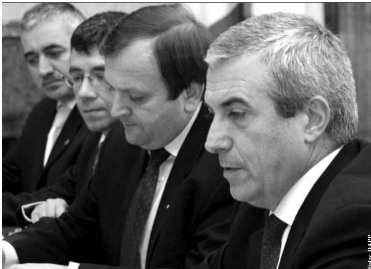
Guvernul a dezbătut de nenumărate ori problemele legate de domeniul sanitar-veterinar

ficări față de forma inițiatorului (Ministerul Justiției). Vor urma dezbaterile în plen. Proiectul de lege privind ANI este urmărit atent de la Bruxelles.