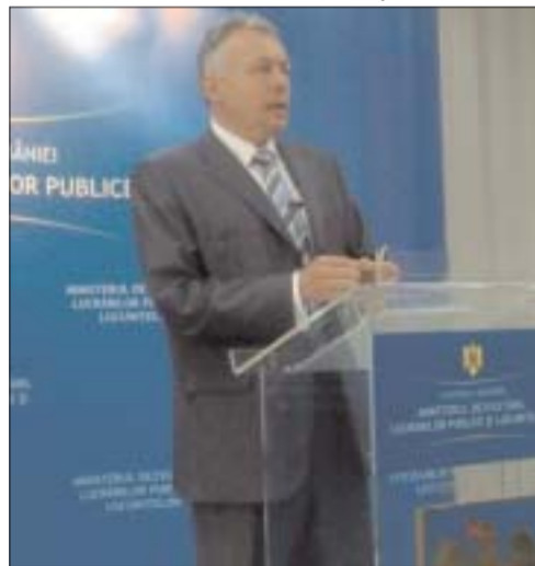
László Borbély, Ministrul Dezvoltării, Lucrărilor Publice și Locuințelor

Ministrul Dezvoltării, Lucrărilor Publice și Locuințelor, László Borbély, a afirmat, la sfârșitul lui noiembrie, că Programul Operațional Regional decurge conform graficului: „s-a lansat în luna iulie, la 10 septembrie s-a