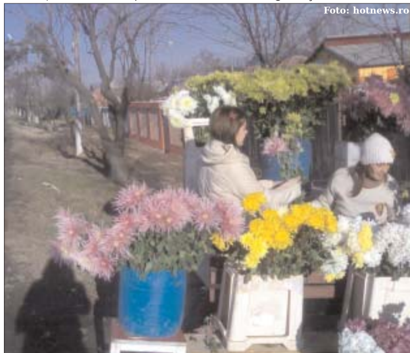
O „afacere de familie” des întâlnită pe marginea Șoselei București-Ploiești

Un proiect în valoare de 121.200 de euro (din care 62.500 obținute prin componenta de turism a programului PHARE), a fost realizat pentru refa-