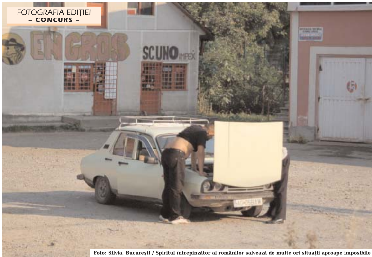
Spiritul întreprinzător al românilor salvează de multe ori situații aproape imposibile

■ 31 decembrie 2007 – Data-limită pentru finanțare oferită de Guvernul României, pentru un Parteneriat cu societatea civilă: Crearea unor surse complementare de consultare sau informare complexă și avizată în elaborarea proiectelor de lege; asigurarea premiselor unei adaptări dinamice și permanente, în timp real, a procesului legislativ, promovarea și exersarea mecanismelor legislative ale Camerei Deputaților. Potențiali beneficiari: persoane juridice nonprofit, care să implementeze proiecte menite să îmbunătățească procesul de elaborare, corectare și exersare a actelor normative aflate în procesul legislativ sau adoptate, cu scopul exercitării eficiente a prerogativelor, funcțiilor și sarcinilor sale. http://www.finantare.ro/program-618-Parteneriatcu-societateacivila.html .