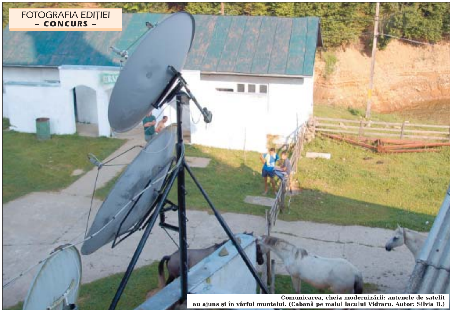
FOTOGRAFIA EDIȚIEI - CONCURS -

■ Octombrie – Lansare licitație deschisă de proiecte: Axa Prioritară 5: „Dezvoltarea durabilă și promovarea turismului” Domeniul Major de Intervenție 5.3 „Promovarea potențialului turistic și crearea infrastructurii necesare, în scopul creșterii atractivității României ca destinație turistică”.