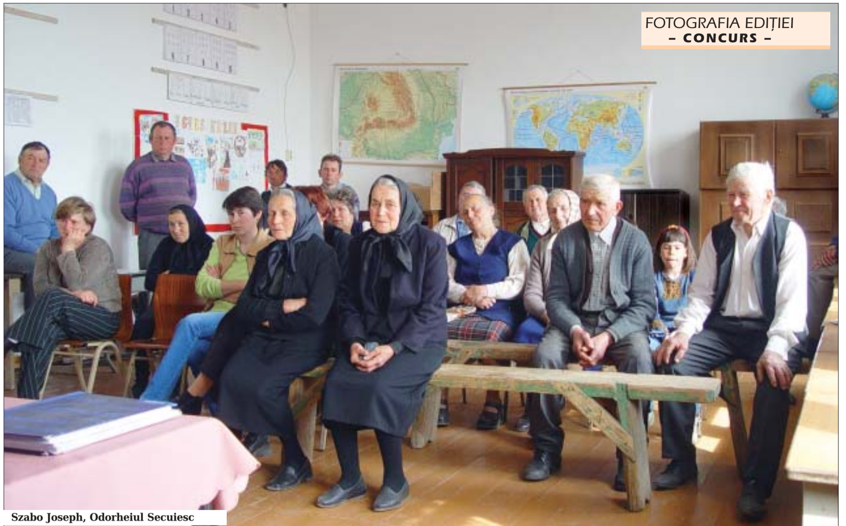
FOTOGRAFIA EDIȚIEI - CONCURS -

◆ 30 noiembrie-1 decembrie – Consiliul Muncă și Probleme Sociale și Consiliul Sănătate și Protecția Consumatorilor. Așa-numitul EPSCO se reunește în jur de patru ori pe an și este compus din miniștrii muncii, protecției sociale, protecției consumatorului, sănătății și șanselor egale din statele membre.