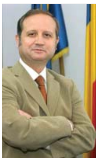
Analiză de Nicolae Idu

Pe un site britanic există o colecție de euro-mituri, dintre care cel mai cunoscut este cel conform căruia România va adera la o uniune de state independente, participând la procesul de integrare europeană așa cum o face de vreo paisprezece ani, respectiv după semnarea Acordului European în 1992. Acesta este un proces continuu și ceea ce diferă de la o etapă la alta este gradul de implicare în raport cu interesul național, capacitățile deținute și angajamentele asumate. Astfel, nicio țară nu este total integrată în UE, nici măcar campionii