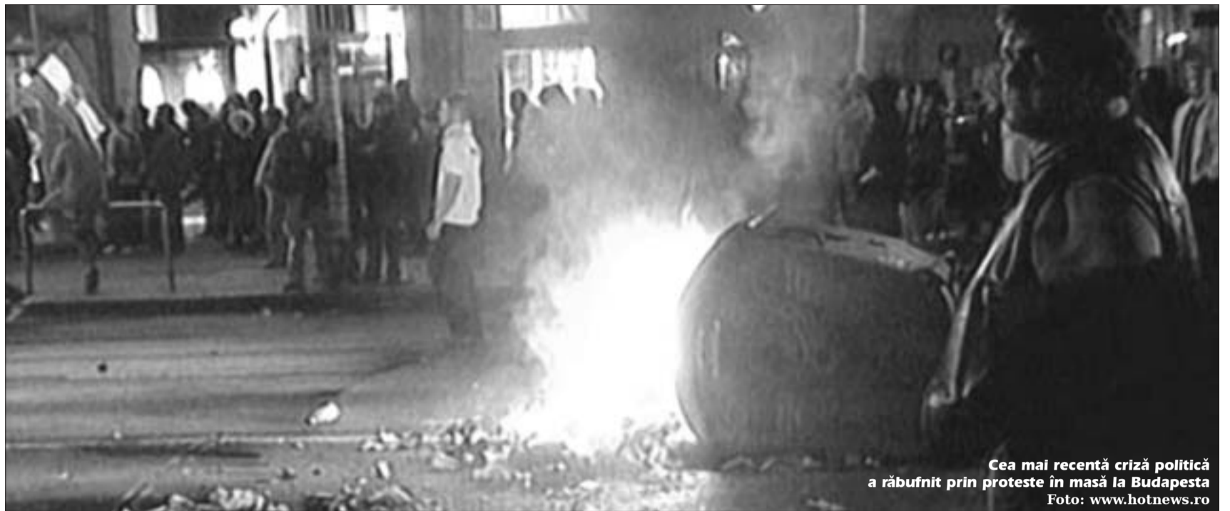
Cea mai recentă criză politică a răbufnit prin proteste în masă la Budapesta