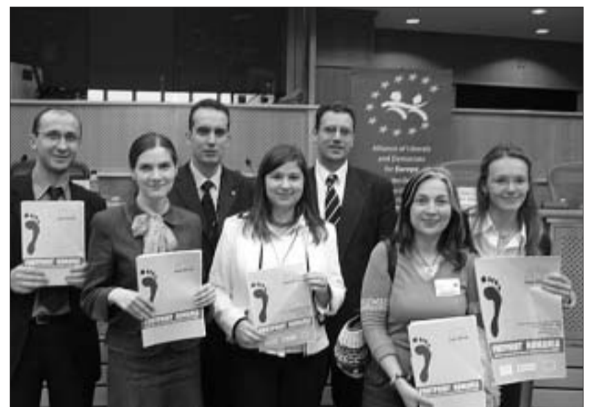
Românii din Bruxelles lansează în Parlamentul European studiul „Amprenta României”

privată. Trăind în altă parte a Europei este nevoie să îți găsești un loc să locuiești, iar piața imobiliară a Belgiei este destul de prietenoasă. Mulți încep prin a-și închiria un apartament, dar doresc să-și achiziționeze o proprietate. Conform statisticilor Ministerului de Finanțe din Belgia, în anul 2005 prețul mediu pentru o tranzacție imobiliară în Bruxelles a fost de 275.500 euro. Cei din țările mediteraneene suferă enorm, din cauza climei umede. Acesta este și un serios factor pentru care mulți spanioli sau italieni nu rezistă prea mult în Bruxelles. Pentru un expatriat programul de muncă este lung, presărat cu întâlniri, prezentări sau lucru individual. Sfârșitul de săptămână este dedicat ieșirilor, și cum să nu fii tentat în a călători când Parisul este la o oră și 30 minute de mers cu trenul, ești la o oră distanță de litoralul Mării Nordului, la două ore și jumătate de Amsterdam și la două ore de Köln. Având în vedere că salariile sunt bune sau chiar grozave pentru unii, vacanțele exotice de o săptămână sunt un adevărat sport în Bruxelles, profitând și de ofertele incredibile de pe piața turistică. Nu mai surprinde